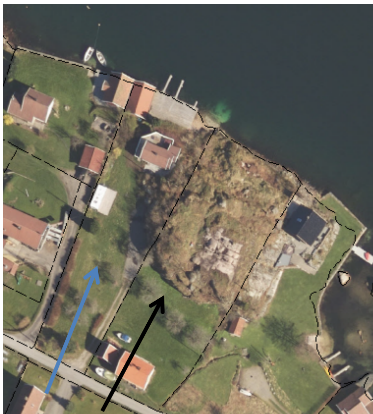
Flyfoto av området. Omsøkte eiendom er markert med svart pil. GB 49/17, eiendommen som dispensasjonen fra 1981 gjelder for, er markert med blå pil

I 1981 ble det gitt dispensasjon fra den daværende strandplanloven (tilsvarende byggeforbudet i 100-metersbeltet langs sjøen etter pbl. § 1-8) for oppføring av en ca. 50 m 2 stor kombinert sjøbod og redskapshus på naboeiendommen GB 49/17.