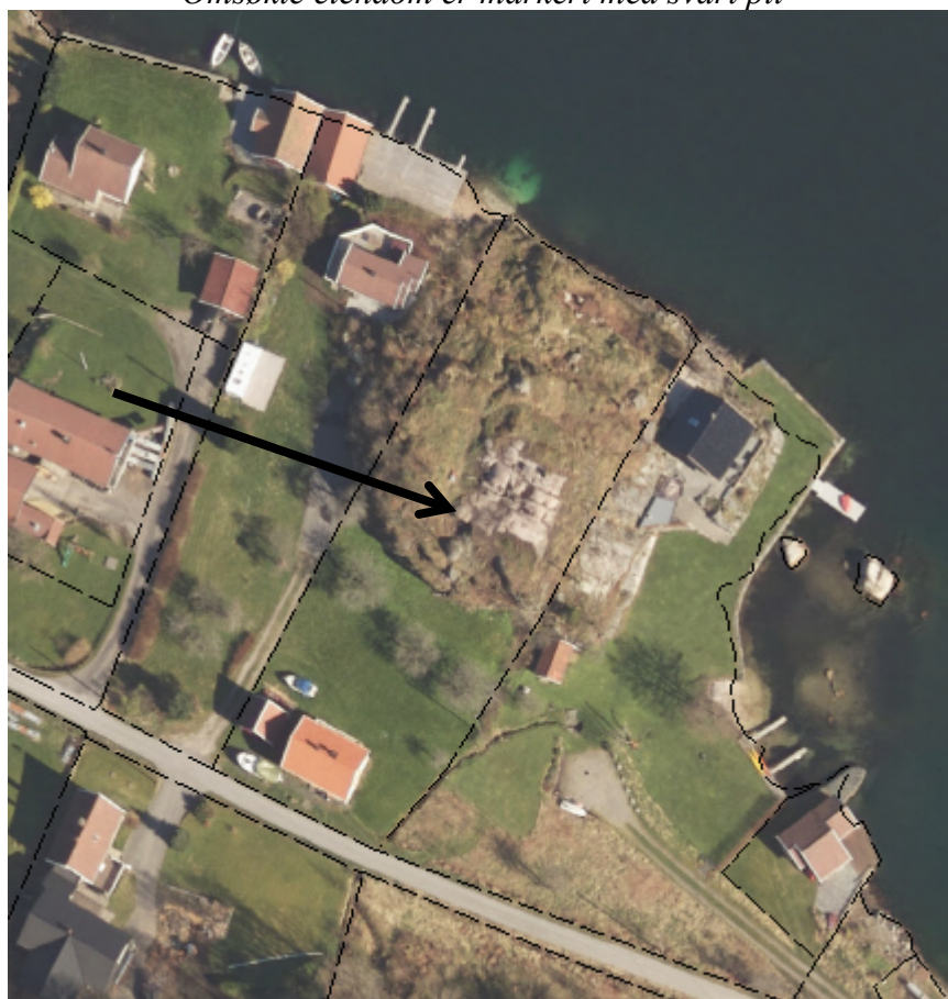
Flyfoto av området. Omsøkte eiendom er markert med svart pil.