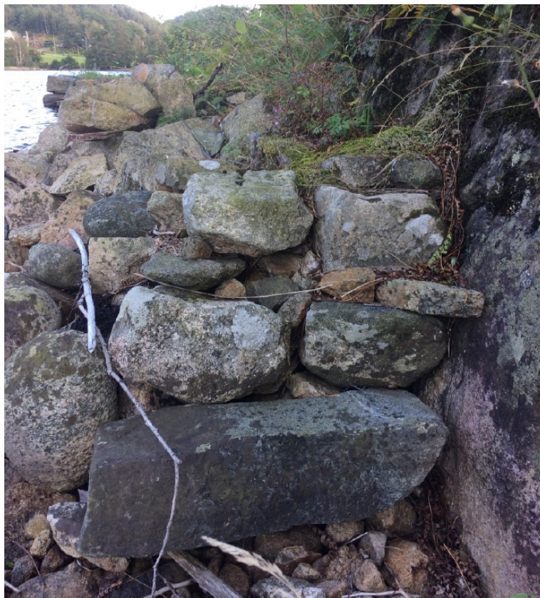
Bilde vedlagt tiltakshavers mail med kommentar til Fylkesmannens uttalelse

«Det var tidligere steinbrygge med steintrapp ned til sjøen, med samme plassering som omsøkt tiltak. Brygga med trapp har rast ut pga. manglende vedlikehold. Dette kommenterte undertegnede på forhåndskonferansen, men det ble konkludert med at det ikke var relevant for saken.»